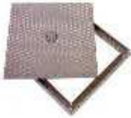
TAMPA SANEAMENTO RASA