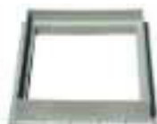
ARO SIMPLES PLASTICO