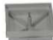
TAMPA PLAST. S/ARO REBAIXADA