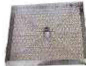
TAMPA SANEAMENTO REBAIXADA 50m XADRES