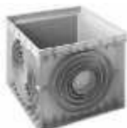
CAIXA ESGOTO PLÁSTICA