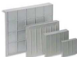
PLACA P/SIFONAR CAIXA