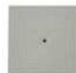
TAMPA S/ ARO PLASTICO