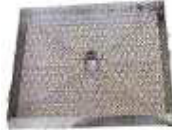
TAMPA SANEAMENTO REBAIXADA 25m XADRES