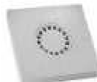
TAMPA PLAST. S/ARO SIFONADA