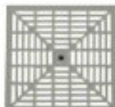
GRELHA PLAST. S/ARO