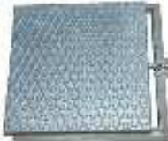
TAMPA P/ POÇO T/ ALÇAPÃO