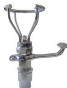
TORN. P/ BEBEDOURO