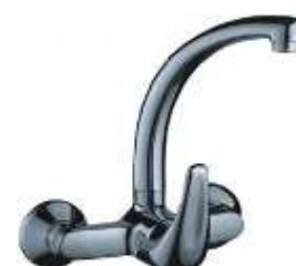
MONOCOM. BANCA PAREDE B/SUPERIOR