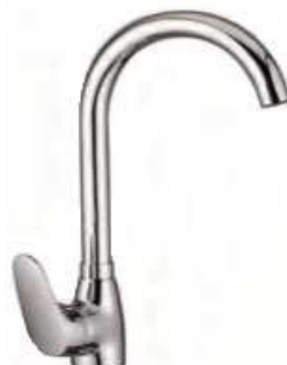
MONOCOM. BALCÃO B/A