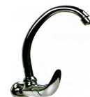
MONOC. GIRAT. PAREDE B/A