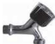
TORNEIRA MAQUINA LAVAR