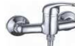
MONOCOM. BASE CHUV.