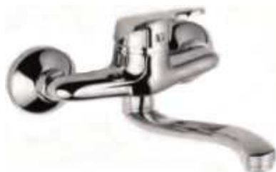
MONOCOM. BANCA PAREDE B/INFERIOR