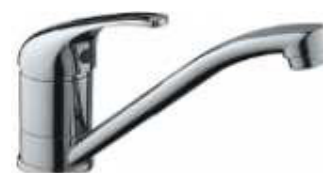
MONOCOM. BALCÃO ITA