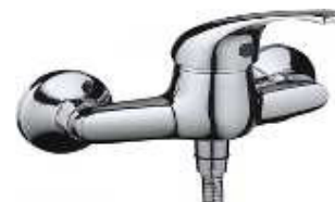
MONOCOM. BASE CHUV.