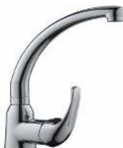
MONOCOM. BALCÃO B/A