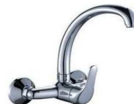
MONOCOM. BANCA PAREDE B/SUPERIOR