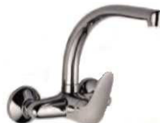
MONOCOM. BANCA PAREDE B/SUPERIOR