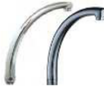
BICA SUPERIOR P/MONOC.