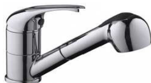
MONOC. BALCÃO C/CHUVEIRO