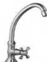
TORN. GIRATÓR. BALCÃO