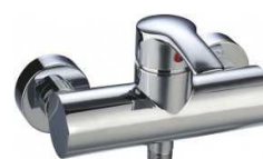
MONOCOM. BASE CHUV.