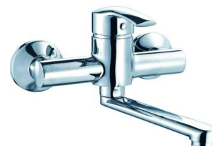
MONOC. PAREDE B/ INF.