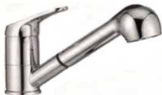
MONOC. BALCÃO C/CHUVEIRO