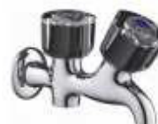
TORNEIRA DUPLA R/BICA