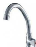
TORN. GIRATÓR. BALCÃO