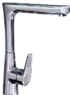
MONOCOM. BALCAO B/A