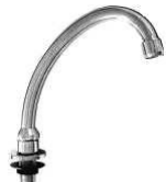
BICA P/TORNEIRA PEDAL