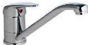
MONOCOM. BALCÃO ITA