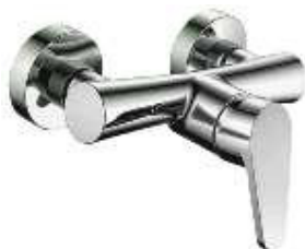
MONOCOM. BASE CHUV.