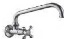
TORN. GIRATÓR. PAREDE