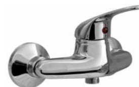
MONOCOM. BASE CHUV.