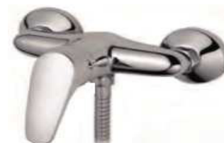
MONOCOM. BASE CHUV.