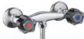
MISTURADORA BASE CHUV.