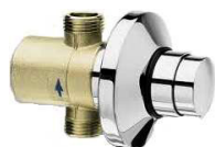
TORN. PASSAGEM INTERIOR