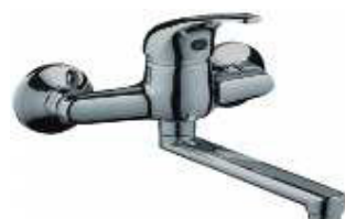
MONOCOM. BANCA PAREDE B/INFERIOR