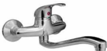
MONOCOM. BANCA PAREDE B/INFERIOR