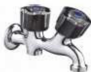
TORNEIRA DUPLA R/ROSCA