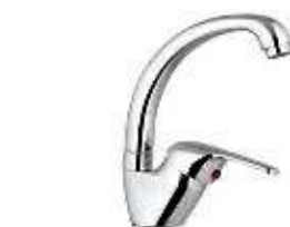
MONOCOM. BALCÃO B/A