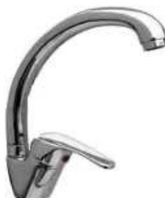
MONOCOM. BALCÃO B/L