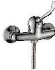
MONOCOMANDO BASE CHV.