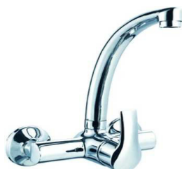
MONOC. PAREDE B/SUP.