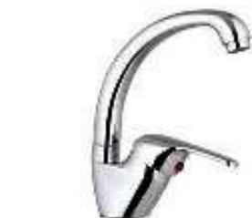
MONOCOM. BALCÃO B/A