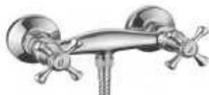
MISTURADORA BASE CHUV.