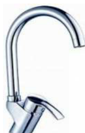
MONOCOM. BALCÃO B/A