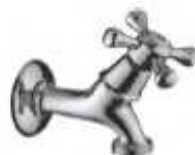
TORNEIRA MAQUINA LAVAR