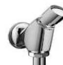
TORN. SANITA 45°