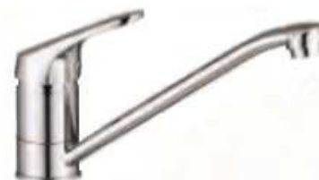
MONOCOM. BALCÃO ITA