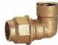
UNIÃO ACOTOV. 90º R/F LATÃO