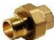
JUNÇÃO S/CÔNICA M/FÊMEA