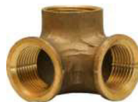
JOELHO 3 VIAS