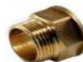
UNIÃO M/F SEXTAVADA