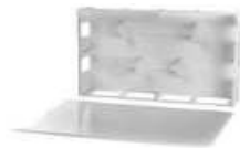
CAIXA P/COLECTOR C/TAMPA