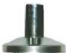
ESPELHO C/CAMPANULA REGULAVEL P/VALV. ESFERA