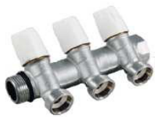
COLECTOR REGULÁVEL M/F 3/4x1/2 TM