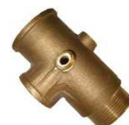
TE 5 VIAS