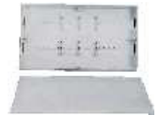
CAIXA P/COLECTOR C/FUROS