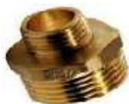
CASQUILHO DUPLO REDUÇÃO