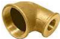
JOELHO REDUÇÃO F/F