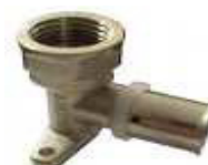
JOELHO C/ PATER