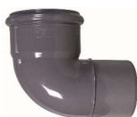
CURVA 87-30 DIN