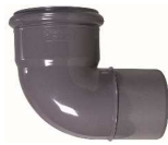
CURVA 87-30 DIN