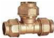
TE BOCA IGUAL LATÃO