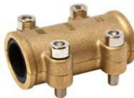
ABRAÇ. TAPA POROS