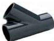
FORQUILHA SIMPLES COLAR