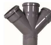
FORQUILHA DUPLA 45° DIN