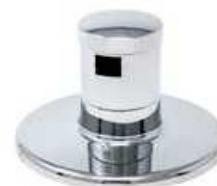
ESPELHO C/CAMPANULA P/VALV. ESFERA