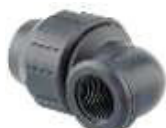
UNIÃO ACOTOV. 90º R/ FEMEA