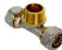
TE R/ MACHO