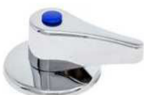
ESPELHO C/MANIPULO P/VALV. ESFERA