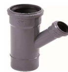
FORQUILHA RED, 45º DIN