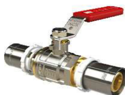
VÁLV. ESFERA C/ MANIPULO P/TUBO MULTICAMADA