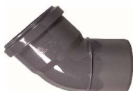
CURVA 45° DIN