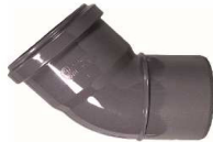
CURVA 45º DIN