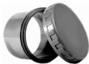
TAMPÃO VISITA ROSCADO