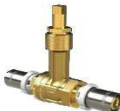
VÁLV. ESFERA ENCASTRAR P/TUBO MULTICAMADA