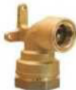
COTOVELO TORNEIRA LATÃO