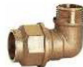
UNIÃO ACOTOV. 90º R/M LATÃO