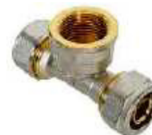
TE ROSCA FEMEA