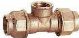
DERIVAÇÃO TE R/ FEMEA LATÃO