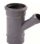
FORQUI. RED. 45° DIN