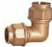
UNIÃO ACOTOV. 90º LATÃO