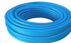
TUBO JARDIM TRI 2000 AZUL