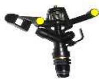
ASPERSORES 3 /4 SIMPLES