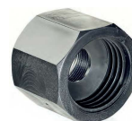
ADAPTADOR P/TAMBOR R/ FEMEA