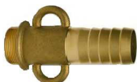
CANHÃO MACHO C/ARGOLAS LATÃO