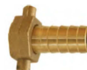
MEIA JUNÇÃO P/MOTOR C/ BORRACHA