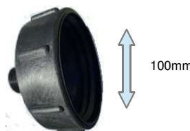
ADAP. TAMBOR S-100 R/ MACHO