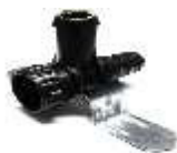
JUNTA FEMEA C/TOMADA