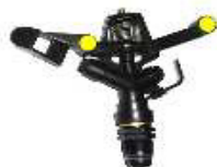
ASPERSORES 3 /4 SIMPLES BICO LATAO