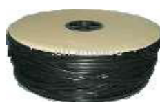
FITA DE REGA