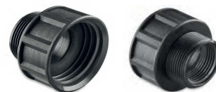
ADAPTADOR P/TAMBOR R/ MACHO