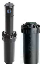
Rain Bird ROSCA 3/4