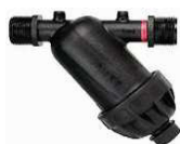
FILTRO DE REDE AZUD