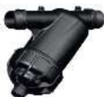
FILTRO DE LAMELAS