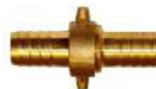
JUNÇÃO DUPLA P/PLÁSTICO