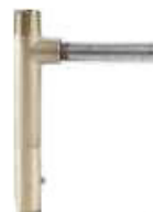
CHAVE P/TOMADA DE AGUA SURE QUICK LATÃO