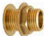
CANHÃO DEPOSITO P/FERRO