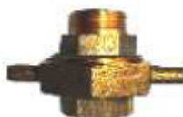
JUNÇÃO MOTOR M/F