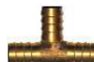
TE LATÃO P/PLÁSTICO