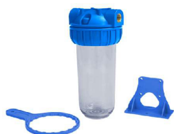
KIT PORTAFILTRO 10'' C/ SUPORTE + CHAVE