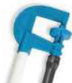
MICRO ASPERSOR C/ESTACA