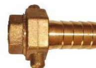
JUNÇÃO MOTOR FÊMEO