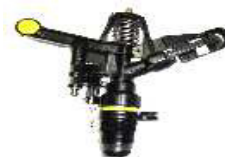
ASPERSORES 3 /4 REGULÁVEL