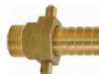
JUNÇÃO MOTOR MACHO