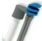
MICRO NUBLIZADOR C/ESTACA