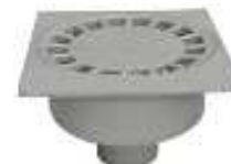
SIFAO PAVIMENTO P.V.C.