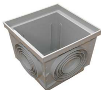
CAIXA ESGOTO PLÁSTICA