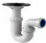
SIFÃO GORDURA SANIJATO