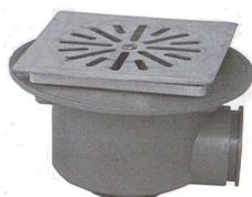
VERTICAL / HORIZONTAL 38301