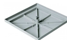
TAMPA PLAST. S/ARO REBAIXADA