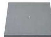
TAMPA S/ ARO PLASTICO