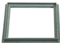
ARO SIMPLE PLASTICO