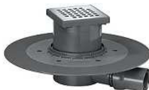
VENISIO GRELHA INOX 15x15