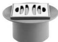
S-150 G/INOX REF.08100