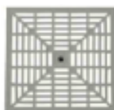
GRELHA PLAST. S/ARO