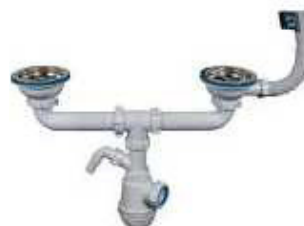
SIFÃO DUPLO CURVO