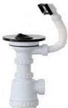
SIFÃO GARRAFA AM C/RESPIRO