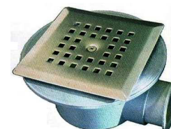
VERTICAL / HORIZONTAL 38302