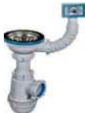
SIFÃO GARRAFA AM C/CESTO E RESPIRO