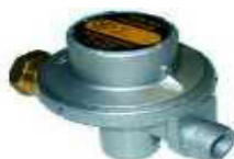
REDUTOR RECA C/ PORCA