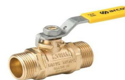
VÁLVULA ESFERA M/M MANIP.