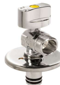
VÁLV. CORTE ESQUEN. GN ARCO