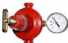
REDUTOR REG. C/MANOM.