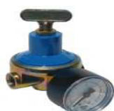
REDUTOR REG. C/MANOM.