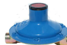
REDUTOR ASTRO 1/4