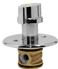
VALV. CORTE FOGÃO GN ARCO