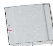
CAIXA P/ CONTADOR GÁS