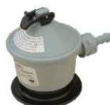
REDUTOR BUTANO BP