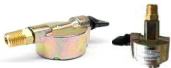
ADAPT. PROPANO P/ GARRAFA GALP