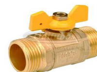
VÁLVULA ESFERA M/M BORB.