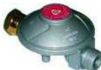
REDUTOR RECA C/ PORCA