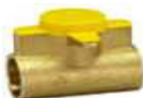
PATER TERMINAL GPL