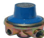
REDUTOR ASTRO 1/4