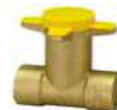
PATER ESQUEN. PASSAGEM