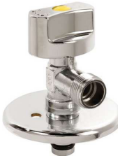
VÁLV. CORTE ESQUEN. GPL ARCO