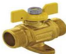
VÁLVULA ESFERA C/BASE