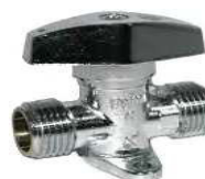
VALV. CORTE V-82