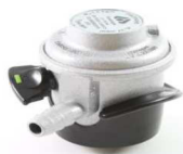
REDUTOR PROPANO BP