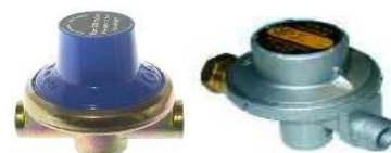
LIMITADOR PRESSÃO 1/4