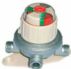
BLOCO INVERS. 8Kgh 1,5 bar