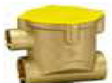
PATER TERM. FOGÃO GN