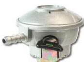
REDUTOR BUTANO GALP